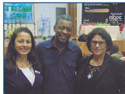
(da esquerda para a Direita)