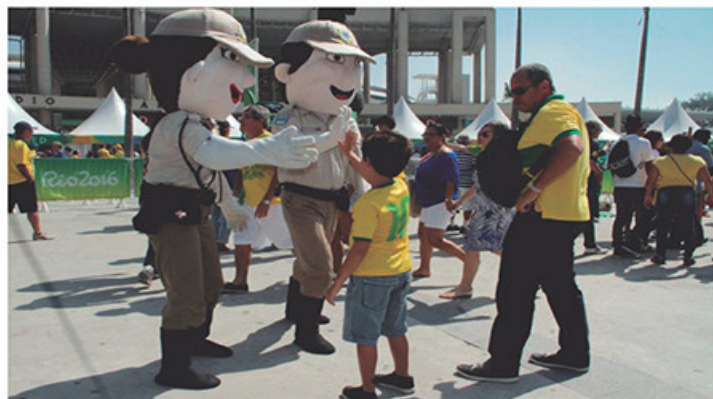
Os bonecos da Guarda Municipal agradaram adultos e crianças em todos os cantos do Rio de Janeiro.